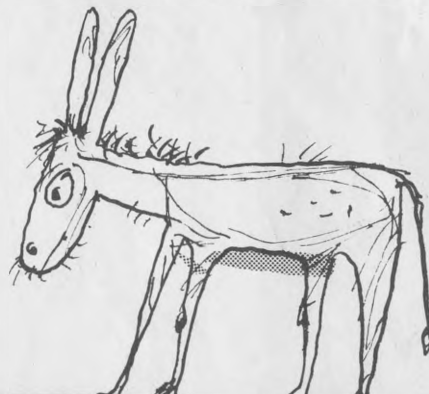
Осел, який не читав поезій Емми Андіївської

— Ти помиляєшся, — сказала друга. — Маєш спільного чоловіка.