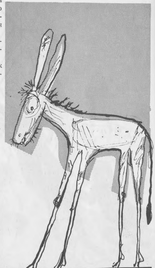
Осел, який читав поезії Емми Андіївської