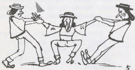
5 Й мене тягли гуляти...