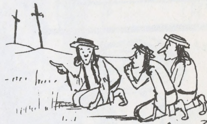
7 Бо в кутку там на цвинтарі,