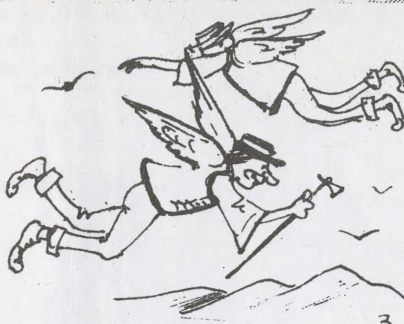
3 Як вихор легіні літали,