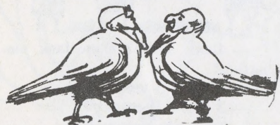
13 Обійко ж їх ховали, черці, як голуби..