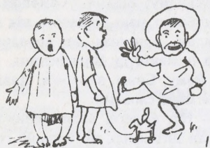
1 Гули цимбали,