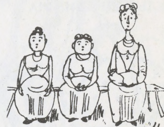
4 Кружок дівчат, як мак лелів.