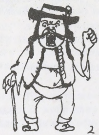
2 бас гудів.