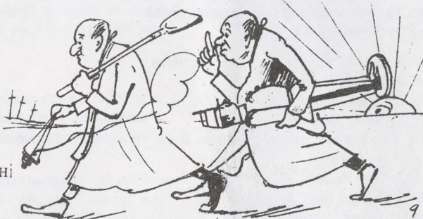
9 А попи там поховали в неділеньку вранці.