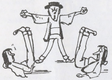
6 НЕ піду, братчики, я з вами.