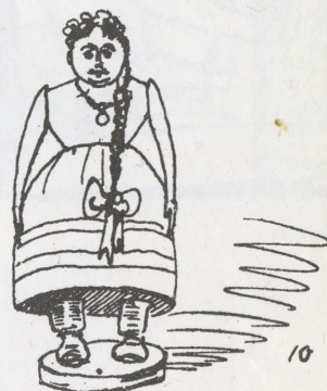
10 А в другу дівчину з чорними очима.