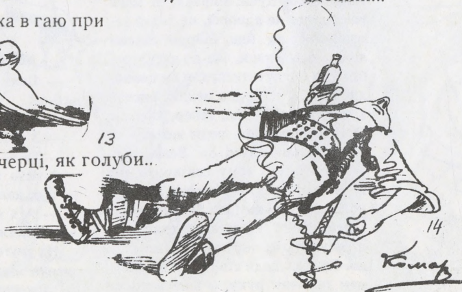
14 Ви гуляйте, а я більше гуляти не буду...

8 MILE AND BEECH і 29805 West Grand River