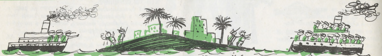
Як Совети виводять війська з Куби