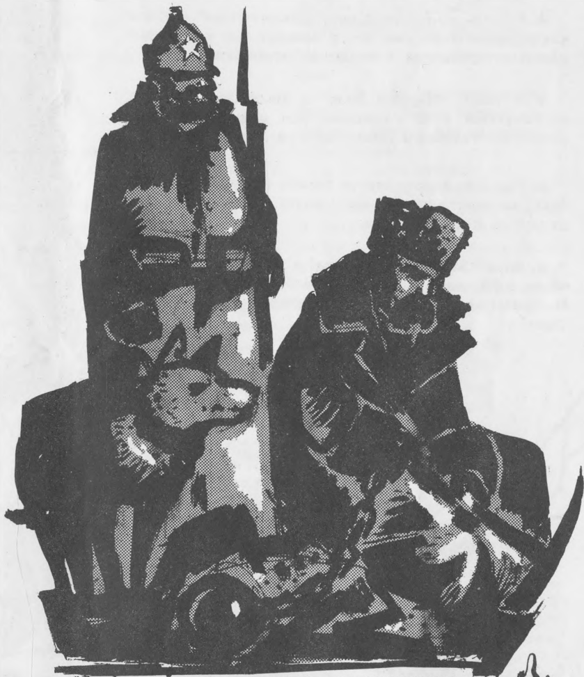
ВІДКИНЕНИЙ ПРОЄКТ ПАМ'ЯТНИКА Т. ШЕВЧЕНКА В МОСКВІ